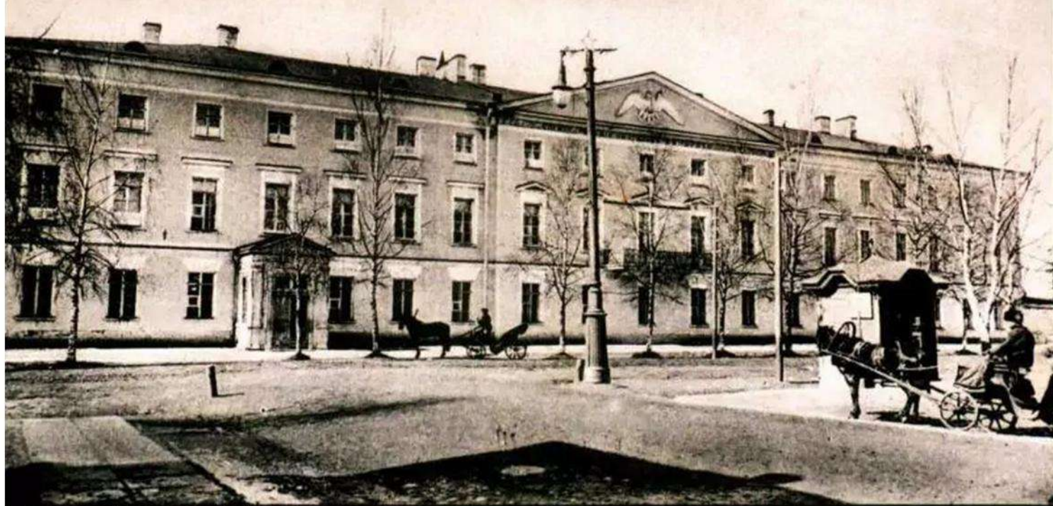
Гатчино. Сиротский Институт Императора Николая I. GATCHINO. L'orphelinat de l'empereur Nicolas I.

С отличием окончив юридический факультет Московского университета, продолжил там же подготовку к сдаче магистерского экзамена. В 1854 г. ему удалось получить работу преподавателя русской словесности в Гатчинском сиротском институте. В 1859 году Ушинского пригласили на должность инспектора классов Смольного института благородных девиц. Одновременно он редактирует «Журнал Министерства народного просвещения».