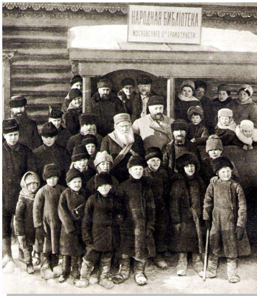
Л.Н. Толстой с учениками Яснополянской школы

Сам Л.Н. Толстой преподавал старшим ученикам математику, физику, историю. На его занятиях дети писали сочинения, лучшие из них потом зачитывали и обсуждали в классе. Давать уроки Лев Толстой продолжал с перерывами до конца жизни. В 1872 году Толстой издал «Азбуку» — четырехтомник с былинами, баснями, загадками для учеников и методическими советами для учителей.