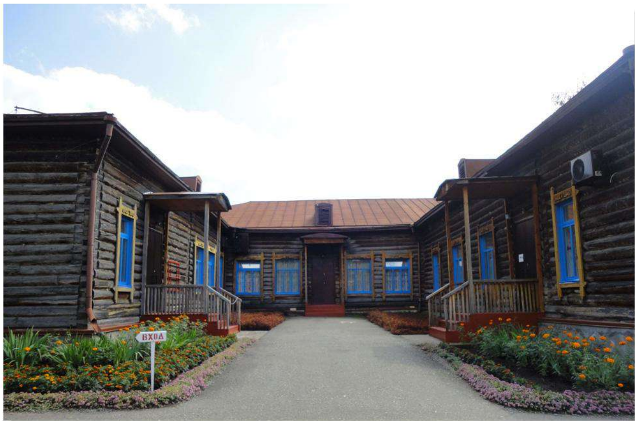
Сростинская сельская школа, где учился и работал В.Шукшин

«Одно время я был учителем сельской школы для взрослых. Учитель я был, честно говоря, неважнецкий (без специального образования, без опыта), но не могу и теперь забыть, как хорошо, благодарно смотрели на меня наработавшиеся за день парни и девушки, когда мне удавалось рассказать им что-нибудь важное, интересное и интересно (я преподавал русский язык и литературу). Я любил их в такие минуты. И в глубине души не без гордости и счастья верил: вот теперь, в эти минуты, я делаю настоящее, хорошее дело. Жалко, мало у нас в жизни таких минут. Из них составляется счастье» (из статьи «Монолог на лестнице»).