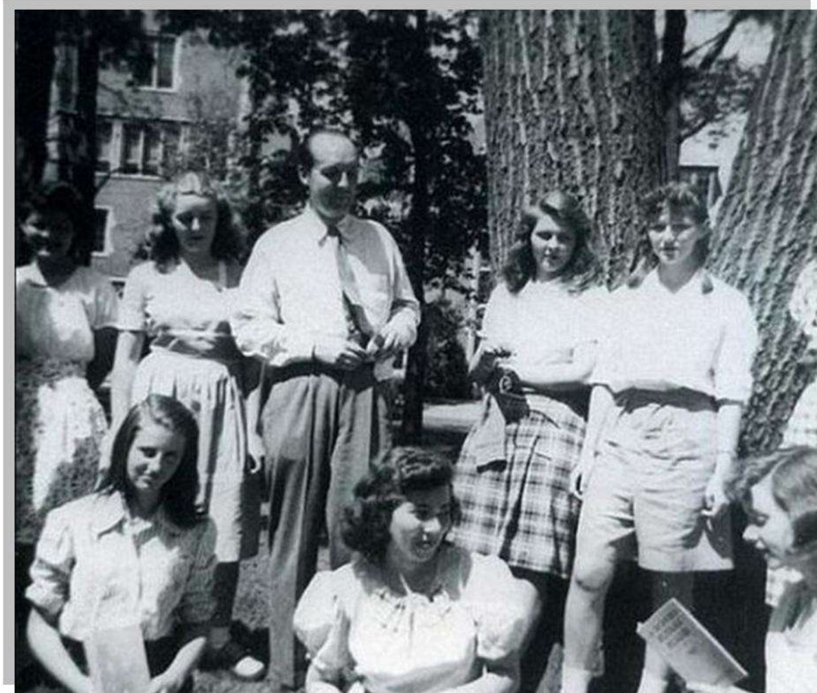
Владимир Набоков со студентами

Набоков требовал от студентов многого: занимать одни и те же места, знать каждое произведения до мельчайших деталей. На лекциях запрещалось «разговаривать, курить, вязать, читать газеты, спать».