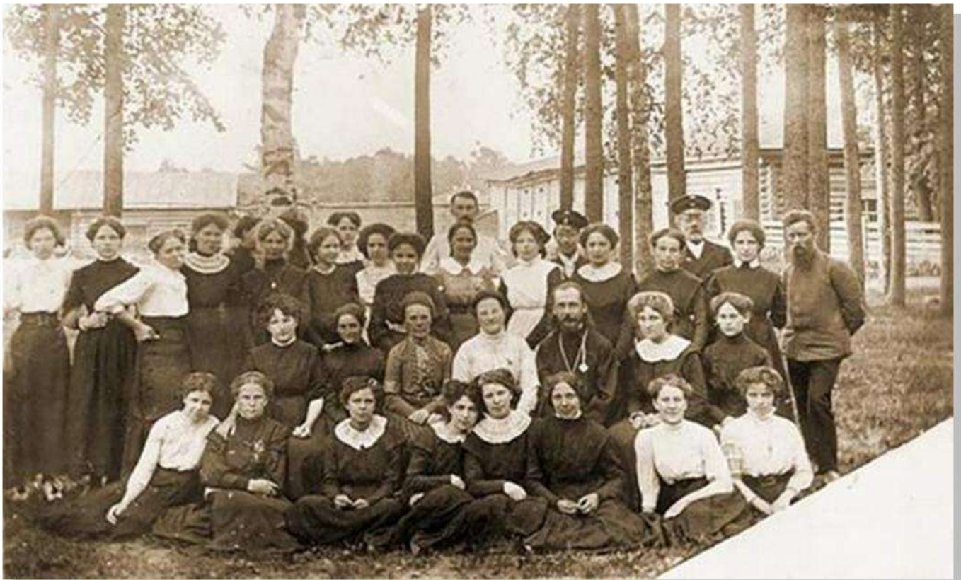
Павел Бажов (справа) среди учениц Епархиального училища

А воспитанницы Екатеринбургского епархиального училища его просто обожали. Когда учителям на литературных вечерах раздавали цветные бантики, Павлу Бажову доставалось больше всего. Подопечные помогали ему собирать материал для сказок: на каникулах записывали пословицы и загадки. Да и сам он времени не терял — в свободное время путешествовал по уральским деревням и слушал старинные предания.